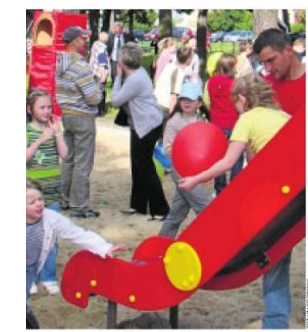
Wciąż tłumy najmłodszych mieszkańców Obronki z rodzicami

Wciąż cieszą się nowymi, rodzicami zabaw