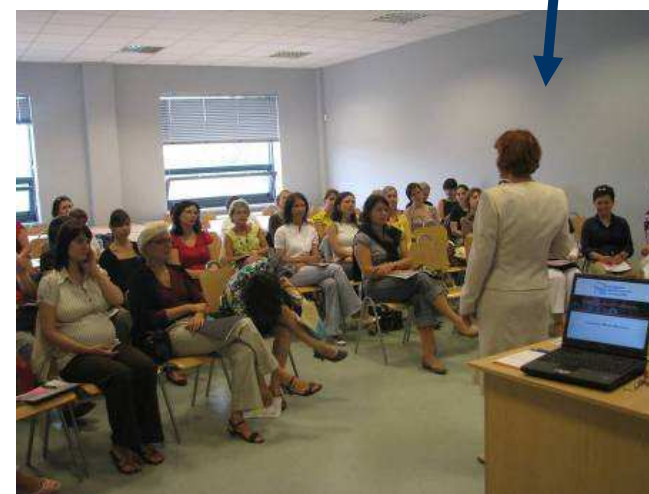
Warsztaty w Rzeszowie 03/09/2008